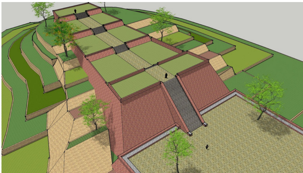
Předpokládaný vzhled stavby

Pyramida na Jávě snad byla stavěna postupně po tisíce let a každý nový stupeň byl založen na původní stavbě, která může být stáří až sto tisíc let. Kdy byl položen základní kámen pyramidy? Abychom se dostali k základně, museli bychom vrtat a vrtat do hloubky nejméně 150 m!