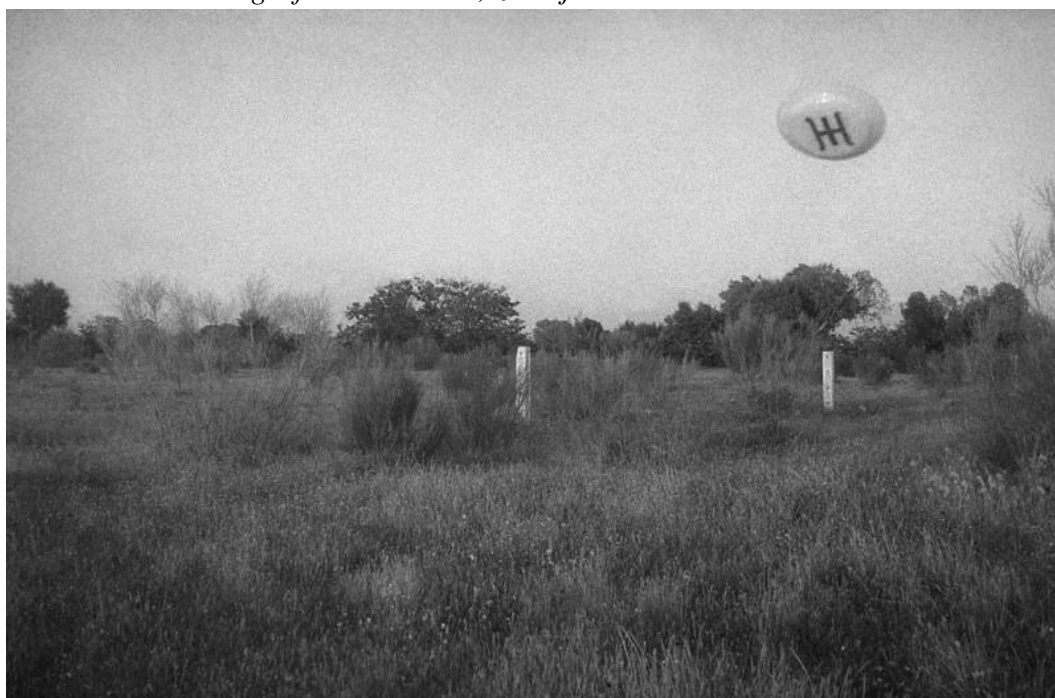
Fotografie lodi Ummo, zveřejněná 1. června 1967.

Celkový počet dopisů byla více než 260 exemplářů, jejich objem překročil 1000 stran napsaných na stroji. Každá stránka těchto dokumentů obsahovala zvláštní piktogram, provedený fialovou barvou. Tyto zprávy Ummitů popisovaly historii jejich pobytu na Zemi. Přiletěli sem v roce 1950 třemi kosmickými loděmi, bylo jejich šest, včetně dvou žen, zkoumají analyzují náš život.