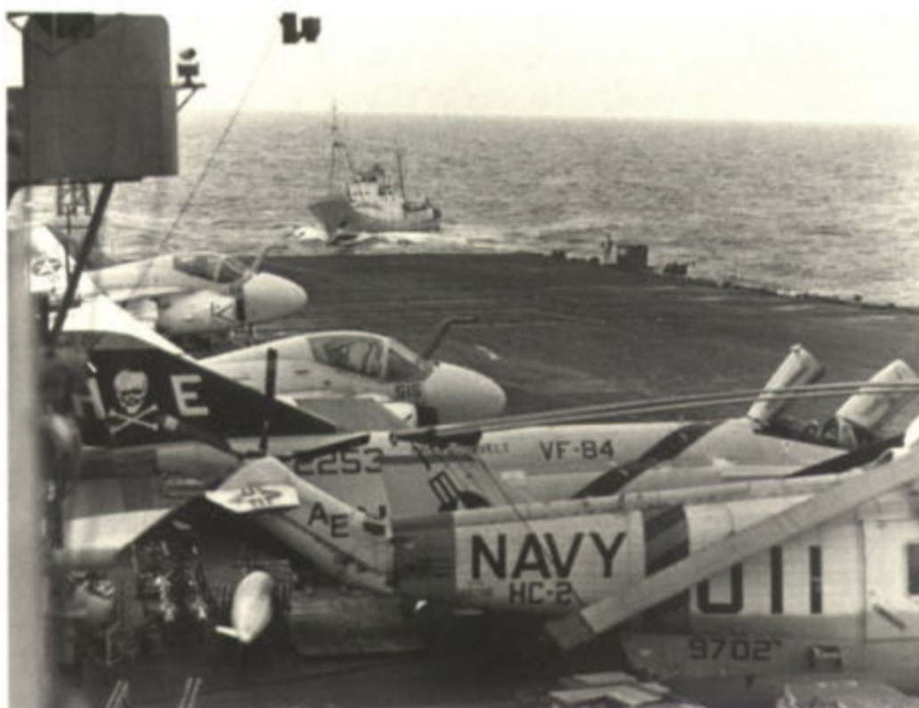
A Soviet intelligence collection ship closes on the stern of the USS Franklin D. Roosevelt underway in the Mediterranean Sea in April, 1975. Soviet and U.S. military units closely monitored each other's forward-deployed forces during the Cold War.