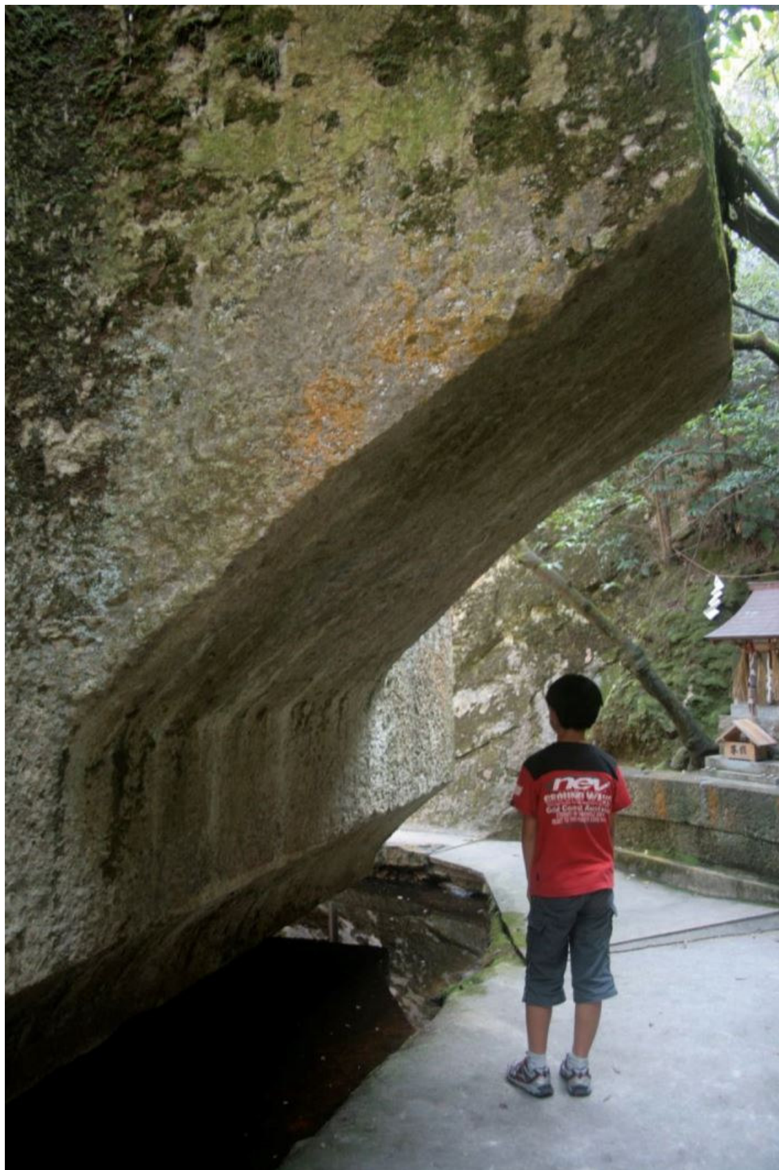
Spodní část megalitu