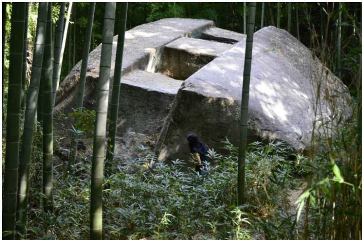
Masuda-ivafun, další obrovský japonský megalit

V letech 2005-2006, „Rada pro vzdělávání“ města Takasago, společně s laboratoří historie na univerzitě Otemae, zorganizovala výzkum megalitu, kdy prováděla trojrozměrné měření za pomoci laseru a pečlivě studovala charakter okolní horniny.