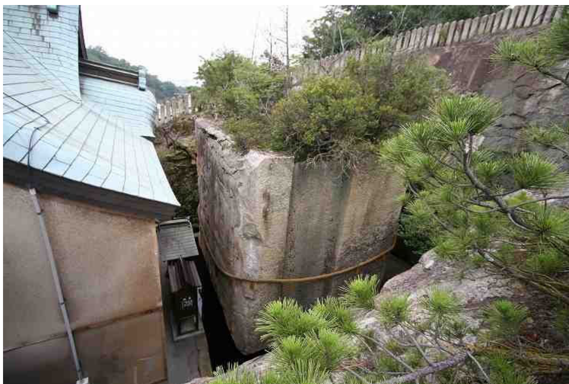
Umístění megalitu vedle masivu