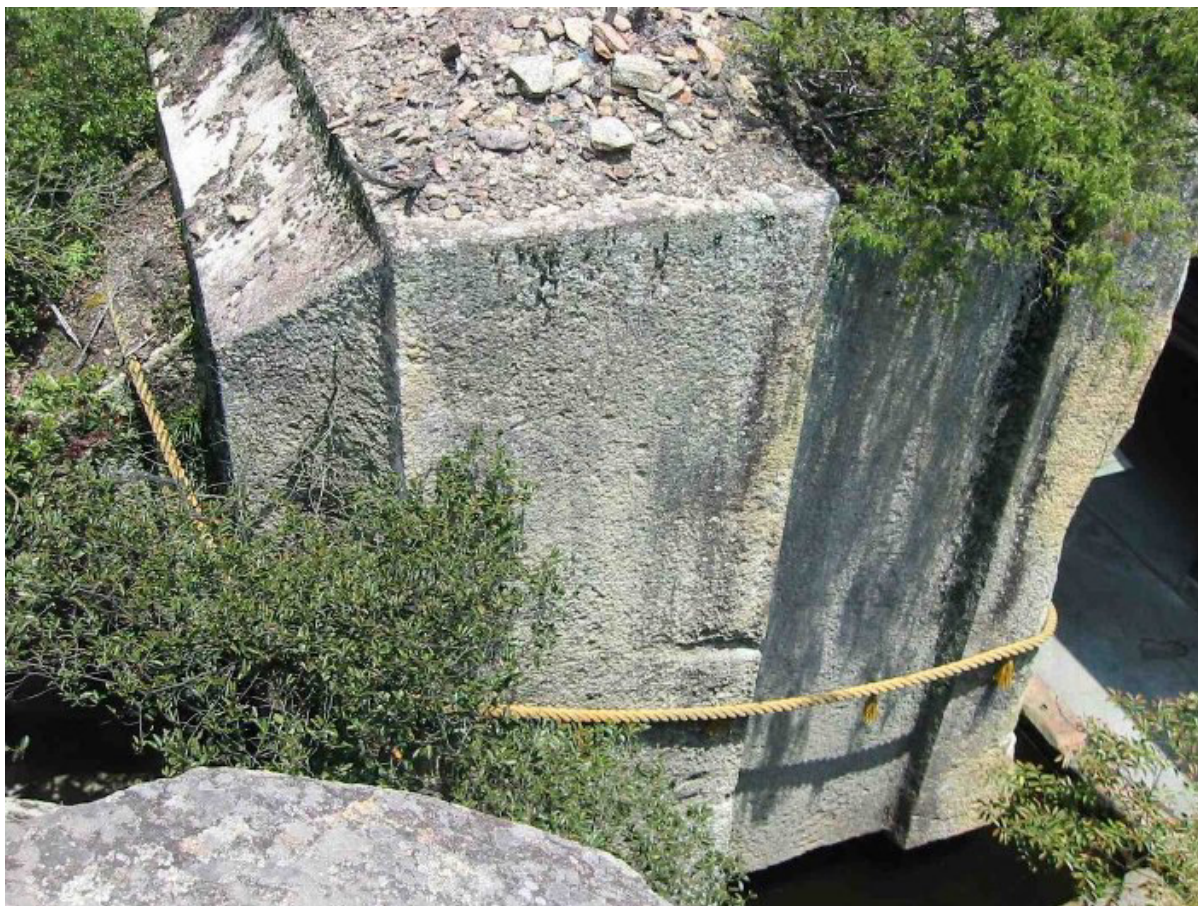
Horní část megalitu