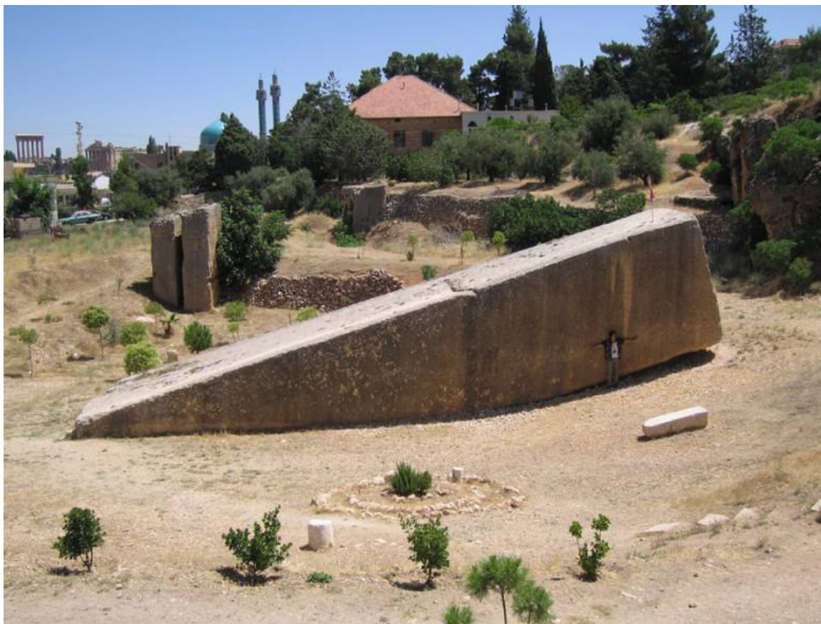
Jižní megalit v Baalbeku

Na jižním kameni jsou stopy nástrojů jasně viditelné pouze na spodní straně monolitu, ve spojení se zdrojovou horninou. Na všech stranách jsou prostě jen příliš nepravidelné prohlubně. Nicméně, na libanonském megalitu jsou tyto kaverny větší než na Ishi-no-Hoden. Kromě toho, máme pocit, že velikost prohlubní v japonském megalitu klesá při pohledu zdola nahoru. Možná by bylo možné připsat nedostatek pravidelných rýh jako výsledek eroze? Nicméně, zdá se, že Ishi-no-Hoden (na rozdíl od kamene v Baalbeku), byl dlouhou dobu zasypán štěrkem a drti, která kdysi spadla z vrcholu hory, možná během některých zemětřesení.